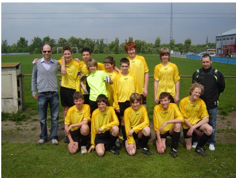
De knapen van OG Vorselaar.

Gespecialiseerd in kleding en alle toebehoren !