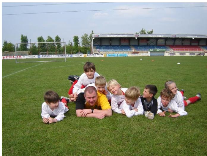
De Duiveltjes van VC Herentals